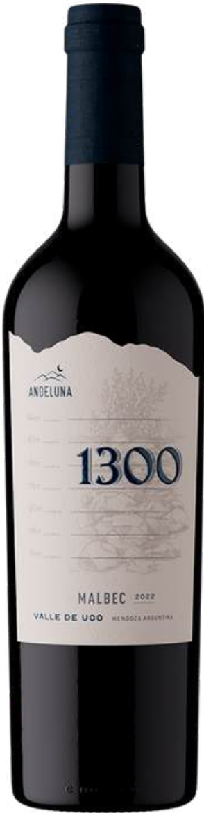
ANDELUNA 1300 MALBEC