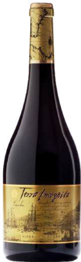
VINO TINTO VILANO TEMPRANILLO TERRA INCOGNITA X 750 ML