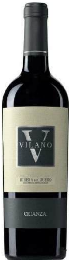
VINO TINTO VILANO TEMPRANILLO CRIANZA X 750 ML