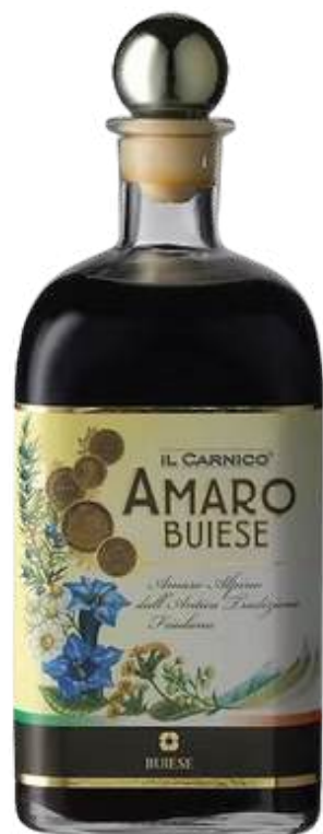
AMARO IR CARNICO X 700 ML

Destilería Buiese, representada por Gourmet 117, es una marca de bebidas alcohólicas premium reconocida por su calidad, sabor y tradición. Ofrece una selección de licores, aguardientes, rones y ginebras elaborados con ingredientes naturales y procesos artesanales. Con más de 100 años de historia, la marca combina innovación y creatividad en cada producto. Su lema es: “Destilería Buiese, el arte de destilar.”