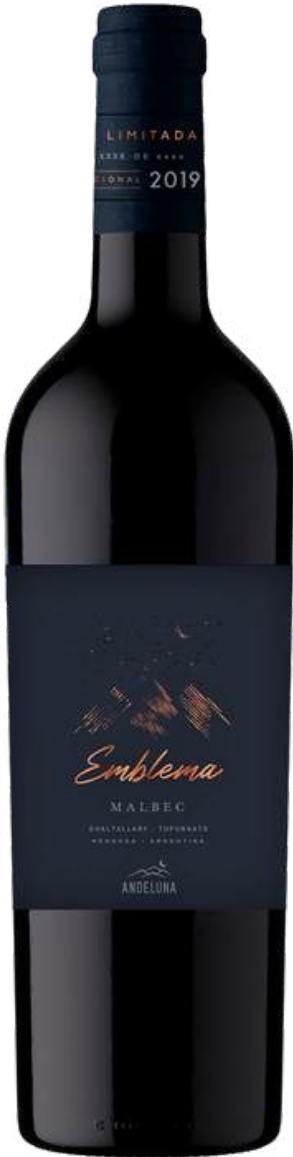
ANDELUNA EMBLEMA MALBEC