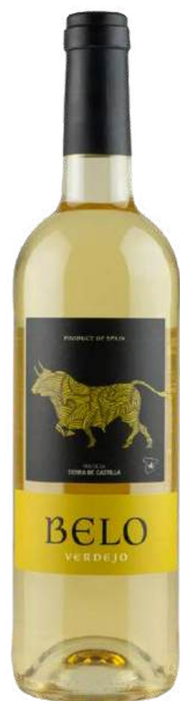
VINO BLANCO BELO VERDEJO X 750ML