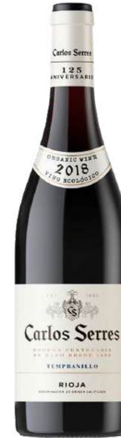
VINO TINTO CARLOS SERRES TEMPRANILLO X 750 ML