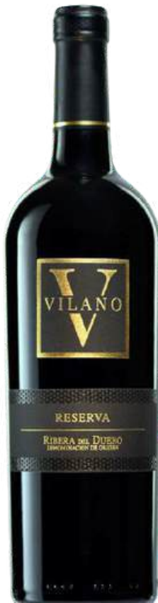
VINO TINTO VILANO TEMPRANILLO RESERVA X 750 ML