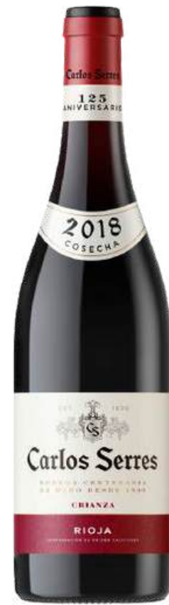
VINO TINTO CARLOS SERRES CRIANZA X 750 ML

El vino tiene historias. Y la historia está llena de vino. La de Carlos Serres (Charles, en francés) es una de ellas. Una de esas que suceden una vez en la vida y permanecen en el tiempo. Procedente de Burdeos, donde la filoxera había comprometido la elaboración de vino, este afamado consultor de vinos franceses encontró en Haro el terruño perfecto para elaborar un estilo bordelés, con unas características climáticas y geográficas que recordaban a los mejores terroirs de Burdeos. Un lugar perfecto para elaborar vinos que cumplieran la expectativa de calidad, sabor y personalidad de los paladares internacionales más exigentes. Vinos perfectos con sabor a Rioja y dispuestos a conquistar incluso en ultramar.