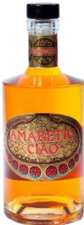
AMARETTO CIAO X 700 ML