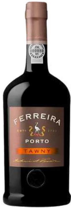
VINO TINTO OPORTO FERRERINHA TAWNY X 750 ML

Aquí tienes el texto tal como aparece en la imagen, sin modificaciones: Sogrape Original Legacy Wines es una bodega reconocida por su excelencia en la producción de vinos que combinan tradición e innovación. Ofrece una amplia variedad de productos, incluyendo vino blanco fresco y aromático, vino tinto estructurado y equilibrado, así como vino espumoso de gran elegancia. Además, cuenta con vino rosado de carácter vibrante y opciones fortificadas con gran riqueza y complejidad. Su compromiso con la calidad y el respeto por la tradición vinícola portuguesa hacen que sus vinos destaquen en el mercado internacional.