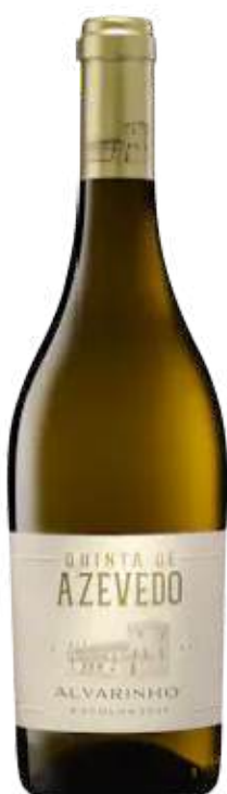
VINO BLANCO QUINTA DE AZEVEDO ALVARINHO ESCOLHA 750 ML CÓDIGO: 8000012