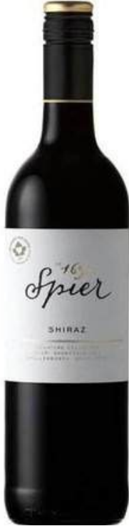
VINO TINTO SPIER SIGNATURE SHIRAZ 750 ML