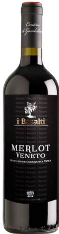
VINO TINTO GAMBELLARA I BASALTI IGT "ROSSO" MERLOT X 750ML