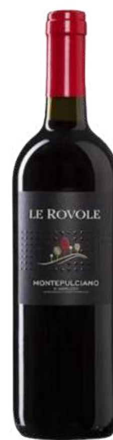
VINO TINTO LE REVOLE MONTEPULCIANO D ABRUZZO X 750ML