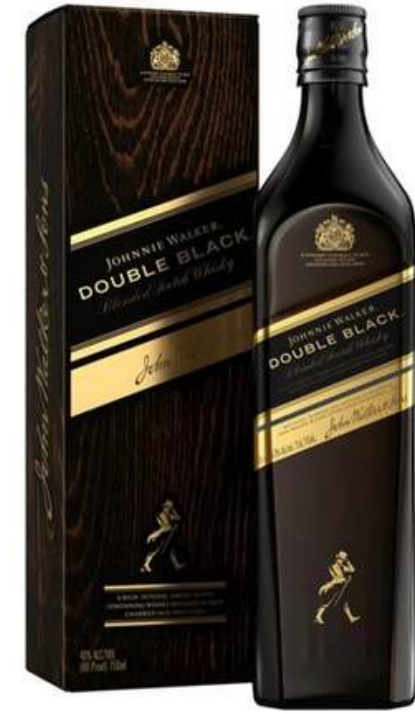
WHISKY JHONNIE WALKER DOUBLE BLACK X 750 ML