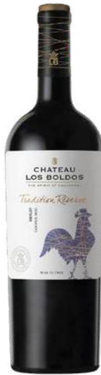
VINO TINTO CHATEAU LOS BOLDOS TRADITION RÉSERVE MERLOT X 750 ML CÓDIGO: 3200005