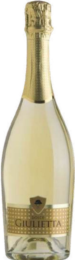
VINO ESPUMANTE GAMBELLARA DULCE GIULIETTA X 750 ML