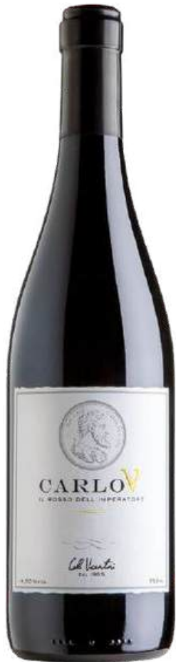
VINO TINTO CARLO V ROSSO VENETO