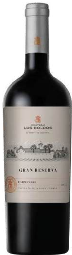
VINO TINTO CHATEAU LOS BOLDOS GRAN RESERVA CHATEAU LOS BOLDOS CARMENERE X 750 ML