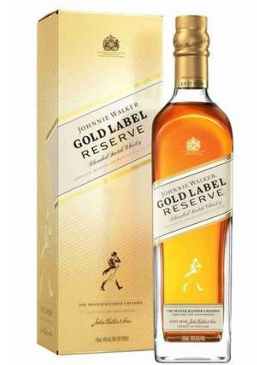
WHISKY JHONNIE WALKER GOLD LABEL X 750 ML