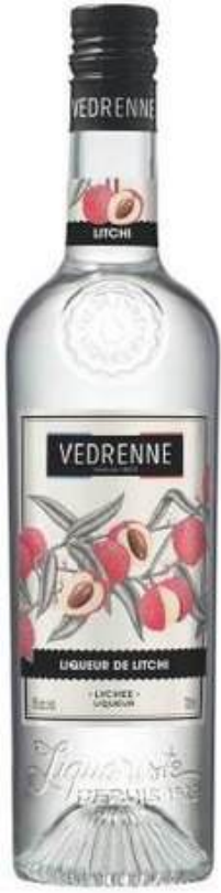
LICOR VEDRENNE LYCHEE 15% 700 ML