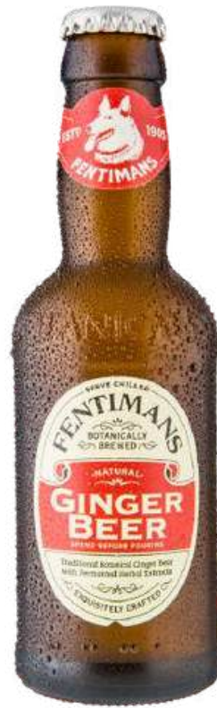
BEBIDAS CARBONATADAS FENTIMANS GINGER BEER X 200 ML CÓDIGO: 20000011 EAN-13: 5029396002462