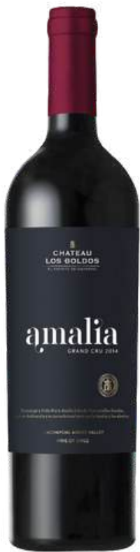
VINO TINTO AMALIA GRAND CRU CABERNET SAUVIGNON - SYRAH - MERLOT X 750 ML CÓDIGO: 3200001

Viña Los Boldos es una bodega chilena ubicada en el Valle de Cachapoal Andes, reconocida por la producción de vinos de alta gama que combinan la tradición europea con el terroir chileno. Fundada en 1991 con el objetivo de elaborar vinos premium, utiliza uvas de sus propios viñedos, plantados desde 1936.