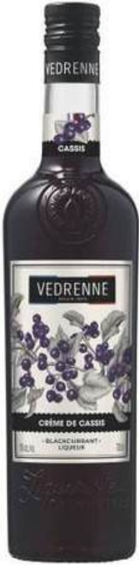
LICOR VEDRENNE BLACKCURRANT LIQUEUR CREME DE CASSIS 15% 700 ML