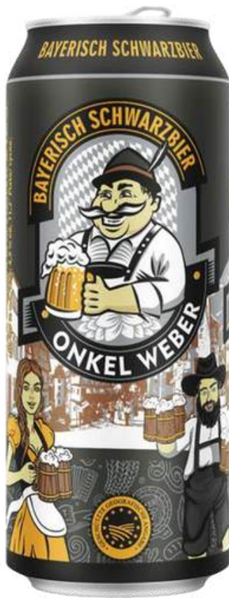
CERVEZA DE CEBADA NEGRA BAYERISCH SCHWARZBIER ONKEL WEBER LATA X 500ML