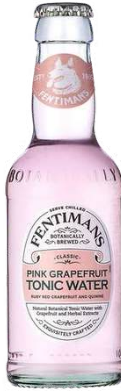
BEBIDA CARBONATADA FENTIMANS PINK GRAPEFRUIT X 200ML CÓDIGO: 20000023 EAN-13: 5029396002424