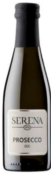
VINO ESPUMANTE SERENA WINES PROSECO DOC FRIZZANTE SCREW CAP X 200 ML