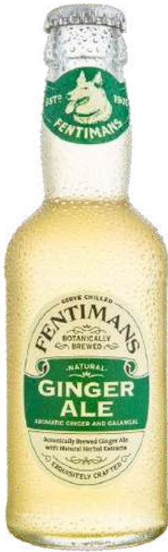
BEBIDAS CARBONATADAS FENTIMANS GINGER ALE X 200 ML CÓDIGO: 20000010 EAN-13: 5029396002486