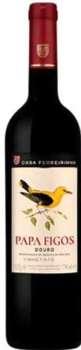
VINO TINTO CASA FERREIRINHA PAPA FIGOS DOURO TINTO X 750 ML