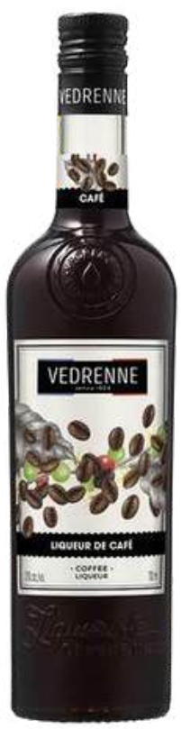
LICOR VEDRENNE COFFEE X 700 ML