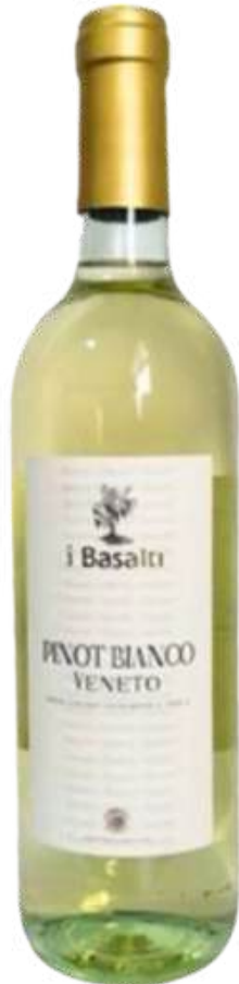
VINO BLANCO GAMBELLARA I BASALTI IGT PINOT BIANCO X 750 ML