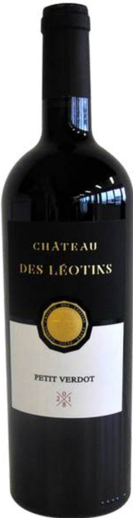
VINO TINTO CHATEAU DES LEOTINS 100% PETIT VERDOT 750 ML