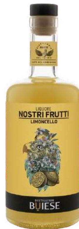
LIMONCELLO X 700 ML