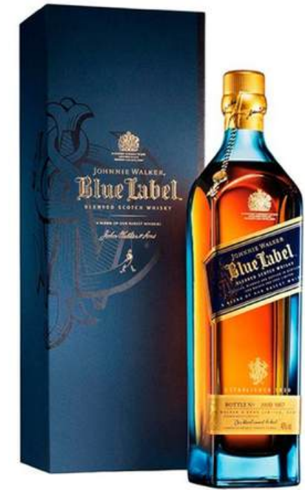
WHISKY JHONNIE WALKER BLUE LABEL X 750 ML