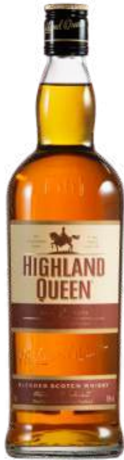
WHISKY HIGHLAND QUEEN 8 AÑOS X 750 ML