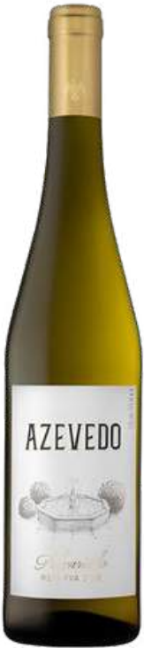
VINO BLANCO AZEVEDO ALVARINHO RESERVA VINHO VERDE X 750 ML CÓDIGO: 8000010