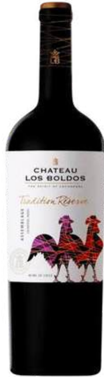
VINO TINTO CHATEAU LOS BOLDOS TRADITION RÉSERVE CABERNET SAUVIGNON - SYRAH X 750 ML CÓDIGO: 3200006