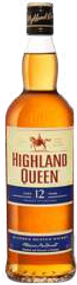
WHISKY HIGHLAND QUEEN 12 AÑOS X 750 ML