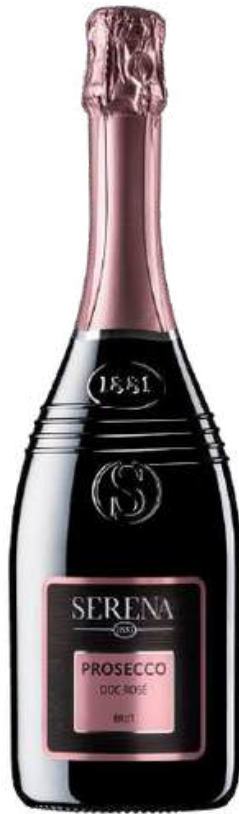
VINO ESPUMANTE SERENA WINES PROSECO DOC ROSE BRUT X 750 ML CÓDIGO: 650004