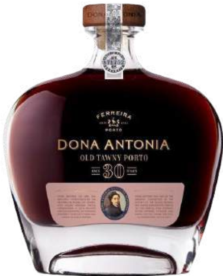
VINO TINTO PORTO DOÑA ANTONIA 30 AÑOS X 750 ML CÓDIGO: 8000013