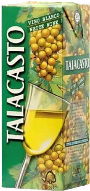
VINO BLANCO TALACASTO TETRA X 1 LT

Bodega Privada es una marca que destaca por su excelente relación calidad-precio, ofreciendo vinos accesibles sin comprometer la calidad. Comprometida con prácticas sostenibles, respeta el medio ambiente y promueve la biodiversidad en sus viñedos. Sus productos están disponibles en tiendas especializadas y plataformas en línea, permitiendo disfrutar de la autenticidad y riqueza de sus vinos en cualquier parte del mundo.