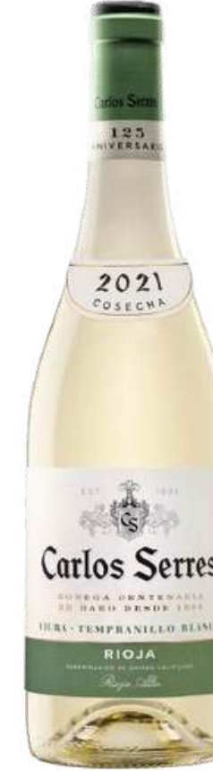
VINO BLANCO CARLOS SERRES TEMPRANILLO X 750ML