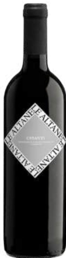
VINO TINTO LE ALTANE CHIANTI DOCG X 750 ML

El Vino Tinto Le Altane Chianti DOCG y el Vino Tinto San Lorenzo Chianti DOCG representan la esencia del Chianti, elaborados principalmente con uvas Sangiovese. Ambos vinos presentan un color rojo rubí brillante y aromas intensos de frutas rojas maduras, con notas florales y especiadas. En boca, ofrecen un equilibrio entre frescura y cuerpo, con una acidez vibrante y taninos que los hacen ideales para acompañar pastas, carnes rojas y quesos curados.