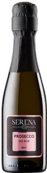
VINO ESPUMANTE SERENA WINES PROSECO DOC ROSE BRUT X 200 ML CÓDIGO: 650002