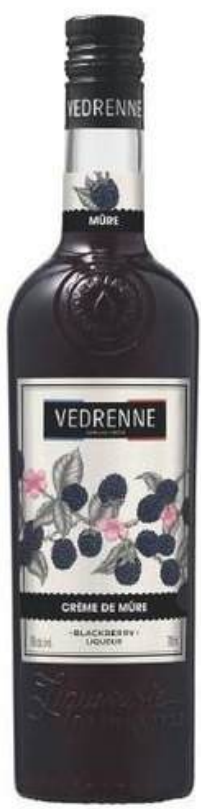
LICOR VEDRENNE BLACKBERRY 15% 700 ML