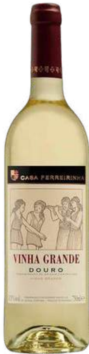
VINO BLANCO CASA FERREIRINHA VINHA GRANDE DOURO BLANCO X 750 ML