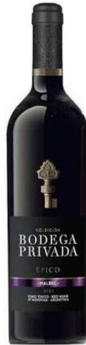
VINO TINTO BODEGA PRIVADA RESERVA EPICO MALBEC X 750 ML