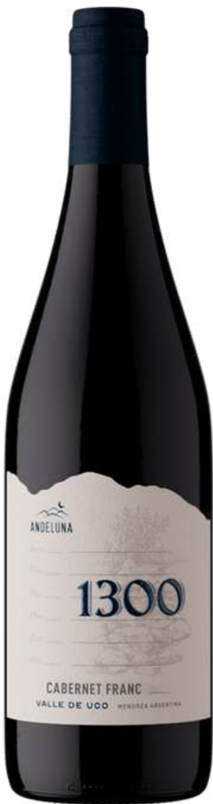
ANDELUNA 1300 CABERNET FRANC