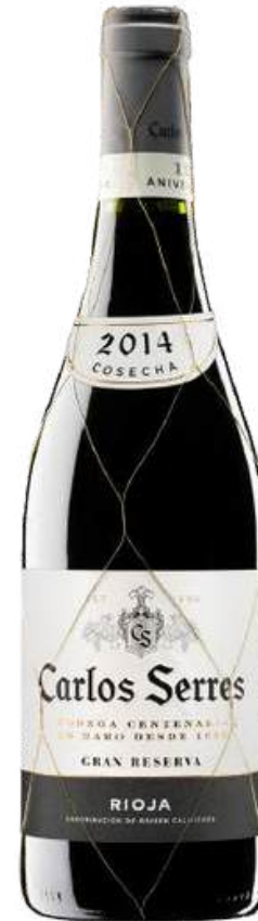
VINO TINTO CARLOS SERRES GRAN RESERVA X 750 ML