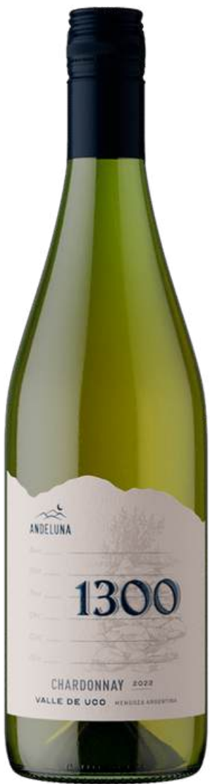
ANDELUNA 1300 CHARDONNAY