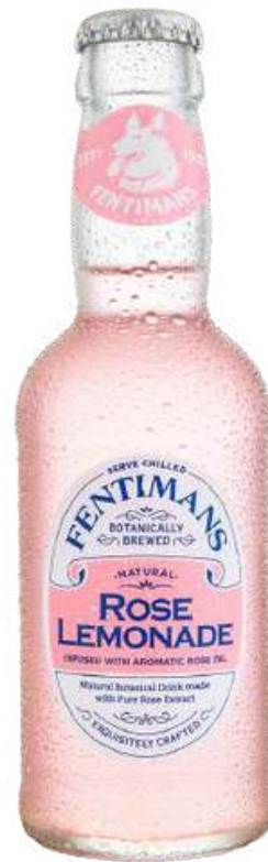
BEBIDAS CARBONATADAS FENTIMANS ROSE LIMONADE X 200 ML CÓDIGO: 20000012 EAN-13: 5029396002479