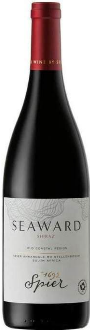
VINO TINTO SPIER SEAWARD SHIRAZ 750 ML

La finca no solo se dedica a la viticultura, sino que también ofrece experiencias enoturísticas, incluyendo degustaciones, recorridos por sus instalaciones históricas y programas de conservación ambiental. Además, Spier es reconocida por su compromiso con la comunidad y el arte, apoyando diversas iniciativas culturales y sociales en la región.