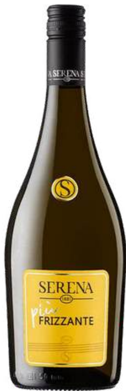
VINO ESPUMANTE SERENA WINES PIU FRIZZANTE SCREW CAP X 750 ML CÓDIGO: 650001

Serena Wines 1881 es una bodega italiana con más de 140 años de historia, ubicada en el corazón de la región del Prosecco, cerca de Conegliano, en la región del Véneto. Fundada en 1881, ofrece una amplia gama de productos que incluyen vinos espumosos y semi-espumosos con denominaciones DOCG, DOC e IGT, así como vinos tranquilos tintos y blancos del Véneto. Entre sus productos destacan diversas versiones de Prosecco, desde el convencional hasta el orgánico y selecciones especiales que marcan tendencia en el mercado.