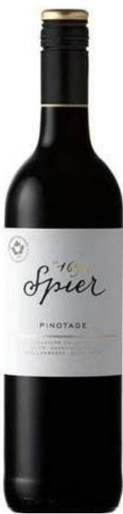
VINO TINTO SPIER SIGNATURE PINOTAGE 750 ML