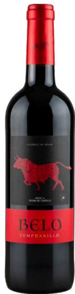
VINO TINTO BELO TEMPRANILLO X 750 ML

Los vinos Belo Tempranillo y Belo Verdejo representan la esencia de los vinos españoles, ofreciendo calidad y autenticidad en cada copa. El Belo Tempranillo es un tinto equilibrado y afrutado, con notas de frutos rojos y un toque especiado, ideal para maridar con carnes y quesos. Su textura suave y una final persistente lo hacen opción versátil y fácil de disfrutar. Por otro lado, el Belo Verdejo es un con blanco fresco y vibrante, aromas cítricos y herbáceos, acompañado de una acidez equilibrada que lo convierte en un excelente acompañante para mariscos, pescados y platos ligeros. Ambos vinos reflejan la tradición vinícola española, combinando accesibilidad y calidad en cada botella.