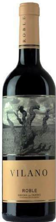
VINO TINTO VILANO TEMPRANILLO ROBLE X 750 ML

Viña Vilano elabora vinos de gran expresión y personalidad, procedentes de viñedos centenarios ubicados en Pedrosa de Duero, una de las zonas de mayor calidad de la D.O. Ribera del Duero. Todos sus vinos están elaborados con uva 100% Tempranillo, también conocida como Tinta Fina o Tinta del País. La bodega cuenta con la más avanzada tecnología para la elaboración de sus vinos, lo que permite ofrecer una amplia gama de productos, entre los que destaca el exclusivo Full Flap, que resalta la pureza y frescura de la variedad Tempranillo. Viña Vilano apuesta por la calidad y la sostenibilidad, combinando tradición e innovación en todos sus productos.