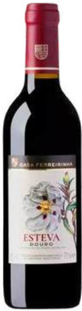
VINO TINTO CASA FERREIRINHA ESTEVA DOURO TINTO X 375 ML