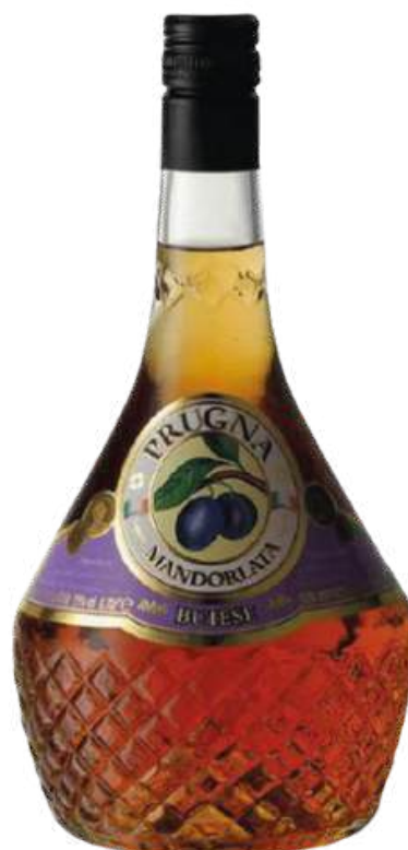
PRUGNA MANDORLATA X 700 ML