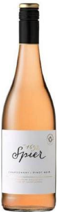
VINO ROSADO SPIER SIGNATURE CHARDONNAY - PINOT NOIR X 750 ML