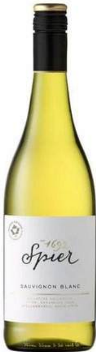
VINO BLANCO SPIER SIGNATURE SAUVIGNON BLANC 750 ML

degustaciones, recorridos por sus instalaciones históricas y programas de conservación ambiental. Además, Spier es reconocida por su compromiso con la comunidad y el arte, apoyando diversas iniciativas culturales y sociales en la región.