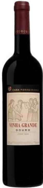
VINO TINTO CASA FERREIRINHA VINHA GRANDE DOURO TINTO X 750 ML