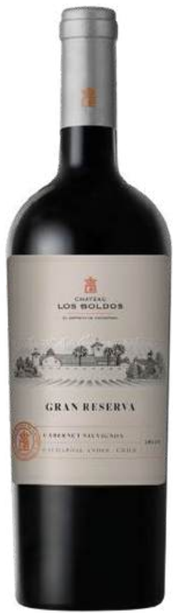
VINO TINTO CHATEAU LOS BOLDOS GRAN RESERVA - CABERNET SAUVIGNON X 750 ML