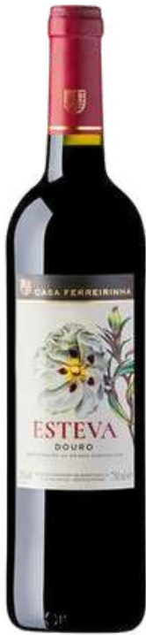
VINO TINTO CASA FERREIRINHA ESTEVA DOURO TINTO X 750 ML CÓDIGO: 8000004