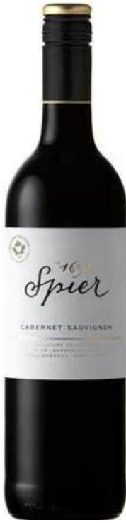
VINO TINTO SPIER SIGNATURE CABERNET SAUVIGNON 750 ML CÓDIGO: 540003