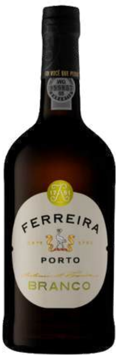
VINO BLANCO PORTO FERREIRA BRANCO 750 ML CÓDIGO: 8000011