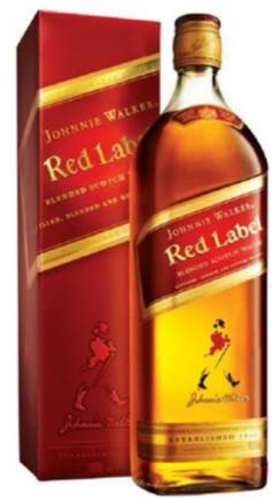
WHISKY JHONNIE WALKER RED LABEL X 750 ML

Fundada en Escocia en 1820, Johnnie Walker es la marca de whisky escocés más reconocida a nivel mundial. Su prestigio se basa en la tradición de sus maestros mezcladores, que han perfeccionado el arte del blended whisky. Con una amplia gama de etiquetas, desde las más suaves hasta las más complejas, Johnnie Walker ofrece calidad, carácter y un sabor inconfundible que invita a disfrutar cada paso.