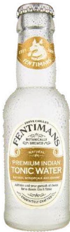
BEBIDAS CARBONATADAS FENTIMANS TONIC WATER X 200 ML CÓDIGO: 20000009 EAN-13: 5029396002400