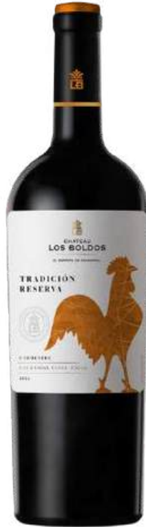
VINO TINTO CHATEAU LOS BOLDOS TRADITION RÉSERVE CARMENERE X 750 ML CÓDIGO: 3200004