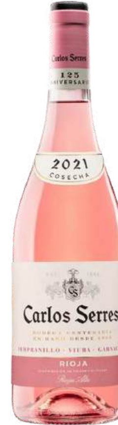
VINO ROSADO CARLOS SERRES TEMPRANILLO X 750ML