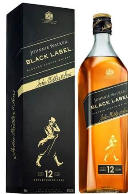
WHISKY JHONNIE WALKER BLACK X 750 ML