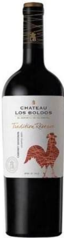
VINO TINTO CHATEAU LOS BOLDOS TRADITION RÉSERVE CABERNET SAUVIGNON X 750 ML CÓDIGO: 3200003