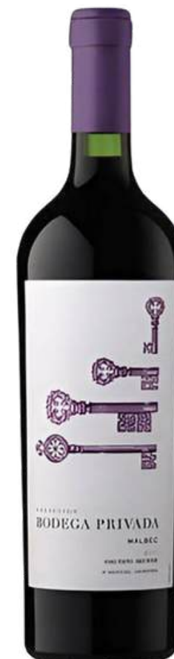
VINO TINTO BODEGA PRIVADA COLECCION MALBEC X 750 ML CÓDIGO: 680004 EAN-13: 7790036001425