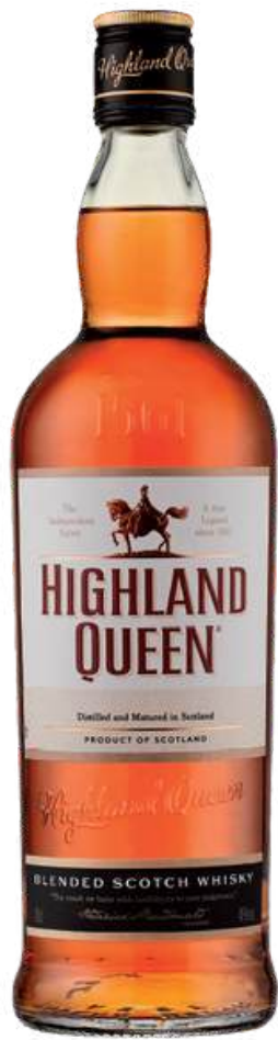
WHISKY HIGHLAND QUEEN CLASSIC X 750 ML

Highland Queen: Esta marca de whisky escocés fue fundada en 1893 por Roderick Macdonald. El nombre "Highland Queen" rinde homenaje a María, Reina de Escocia, y la marca ha mantenido una reputación de calidad en la producción de whiskies blended y single malt, reflejando la tradición y el carácter de las tierras altas escocesas