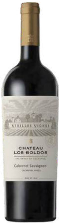
VINO TINTO VIEILLES VIGNES CABERNET SAUVIGNON X 750 ML CÓDIGO: 3200002