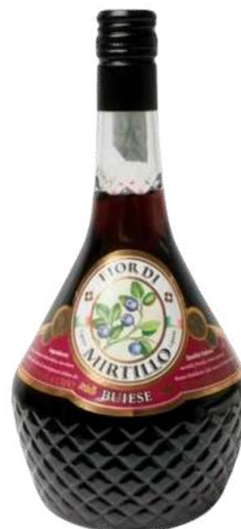
FIOR DI MIRTILLO X 700 ML