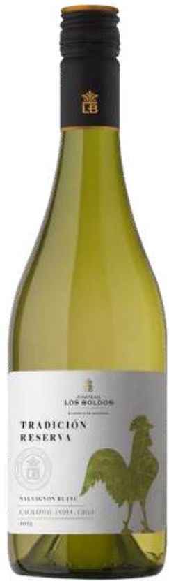
VINO BLANCO CHATEAU LOS BOLDOS TRADITION RÉSERVE SAUVIGNON BLANC X 750 ML CÓDIGO: 3200007

Viña Los Boldos es una bodega chilena ubicada en el Valle de Cachapoal Andes, reconocida por la producción de vinos de alta gama que combinan la tradición europea con el terroir chileno. Fundada en 1991 con el objetivo de elaborar vinos premium, utiliza uvas de sus propios viñedos, plantados desde 1936.