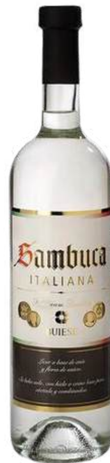
SAMBUCA X 700 ML