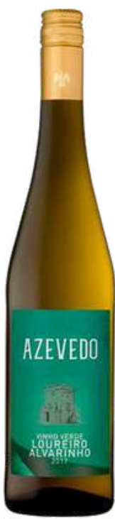
VINO BLANCO QUINTA DE AZEVEDO VINHO VERDE X 750 ML CÓDIGO: 8000009

Aquí tienes el texto tal como aparece en la imagen, sin modificaciones: Sogrape Original Legacy Wines es una bodega reconocida por su excelencia en la producción de vinos que combinan tradición e innovación. Ofrece una amplia variedad de productos, incluyendo vino blanco fresco y aromático, vino tinto estructurado y equilibrado, así como vino espumoso de gran elegancia. Además, cuenta con vino rosado de carácter vibrante y opciones fortificadas con gran riqueza y complejidad. Su compromiso con la calidad y el respeto por la tradición vinícola portuguesa hacen que sus vinos destaquen en el mercado internacional.