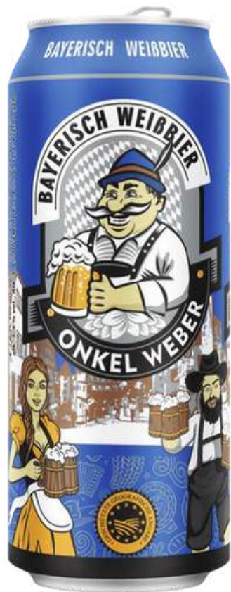
CERVEZA DE TRIGO BAYERISCH WEIBBIER ONKEL WEBER LATA X 500ML

Es una marca de cervezas de estilo alemán, reconocida por su calidad artesanal y variedad de estilos tradicionales. Aunque no se dispone de información detallada sobre su historia específica, la marca se destaca por ofrecer cervezas que reflejan la rica tradición cervecera alemana.