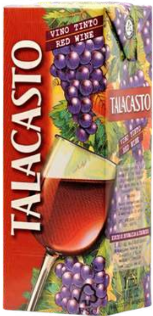
VINO TINTO TALACASTO TETRA X 1 LT