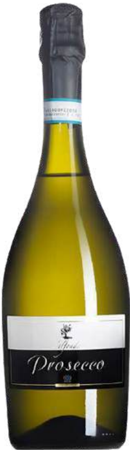
VINO ESPUMANTE GAMBELLARA VALFONDA PROSECCO ESPUMANTE D.O.C X 750 ML