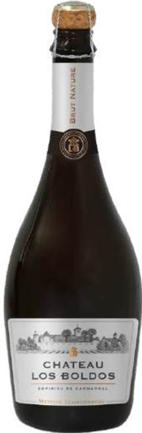
VINO ESPUMANTE CHATEAU LOS BOLDOS METHODE TRADITIONNELLE X 750 ML