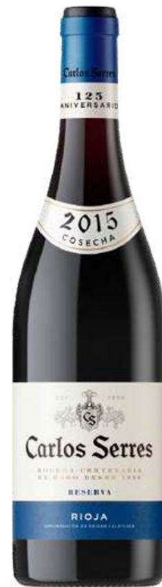
VINO TINTO CARLOS SERRES RESERVA X 750 ML