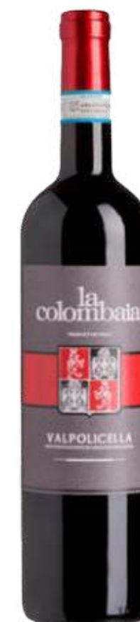
VINO TINTO LA COLOMBAIA VALPOLICELLA X 750ML