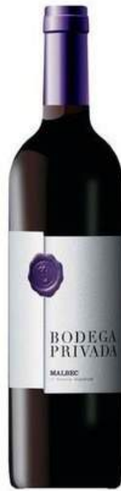
VINO TINTO BODEGA PRIVADA LACRADO MALBEC X 750 ML