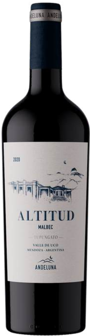
ANDELUNA ALTITUD MALBEC

La bodega combina técnicas tradicionales y modernas fermentaciones precisas, crianza en barricas y ánforas para resguardar la identidad del lugar. El resultado son vinos elegantes, vibrantes y auténticos, que unen la esencia de la montaña, el cielo y la tierra en cada copa.