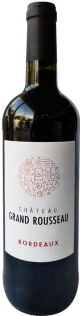
VINO TINTO CHATEAU GRAND ROUSSEAU 750 ML