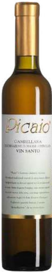
VINO BLANCO GAMBELLARA "PICAIO" VIN SANTO X 375 ML

Cantina Gambellara, representada por Gourmet 117, es una marca de vinos premium elaborados con pasión y tradición por una familia de viticultores con más de 70 años de experiencia. Sus vinos se distinguen por sus características especiales que reflejan el terruño y la personalidad de cada variedad, desde blancos frescos y afrutados hasta tintos intensos y complejos. a dCiasnfrtuinta r dGea mlab eblulaernaa cionmviitdaa , el buen vino y la buena compañía.