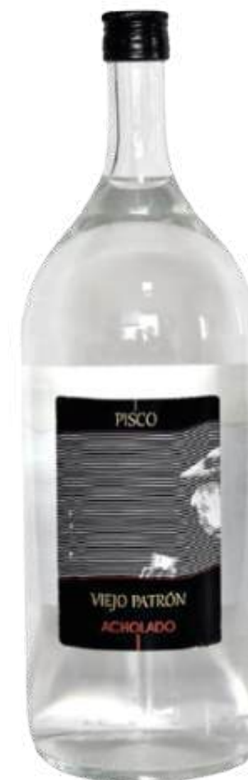
PISCO VIEJO PATRON ACHOLADO X 2 LTRS