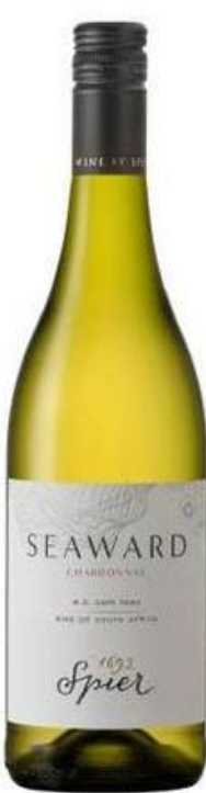
VINO BLANCO SPIER SEAWARD CHARDONNAY X 750 ML