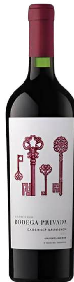
VINO TINTO BODEGA PRIVADA COLECCION CABERNET SAUVIGNON X 750 ML CÓDIGO: 680003 EAN-13: 7790036001470

Bodega Privada es una marca que destaca por su excelente relación calidad-precio, ofreciendo vinos accesibles sin comprometer la calidad. Comprometida con prácticas sostenibles, respeta el medio ambiente y promueve la biodiversidad en sus viñedos. Sus productos están disponibles en tiendas especializadas y plataformas en línea, permitiendo disfrutar de la autenticidad y riqueza de sus vinos en cualquier parte del mundo.