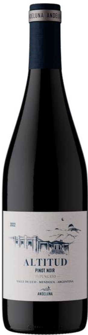
ANDELUNA ALTITUD PINOT NOIR

La bodega combina técnicas tradicionales y modernas fermentaciones precisas, crianza en barricas y ánforas para resguardar la identidad del lugar. El resultado son vinos elegantes, vibrantes y auténticos, que unen la esencia de la montaña, el cielo y la tierra en cada copa.