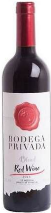
VINO TINTO BODEGA PRIVADA BLEND X 750 ML