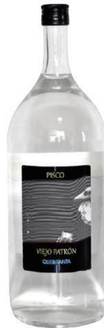
PISCO VIEJO PATRON QUEBRANTA X 2 LTRS

Pisco Viejo Patrón Quebranta es un tipo de pisco, un aguardiente de uva tradicional producido en Perú. El pisco se elabora mediante la destilación del jugo de fermentado, lo que resulta en un licor transparente e incoloro con un aroma y sabor fuertes.