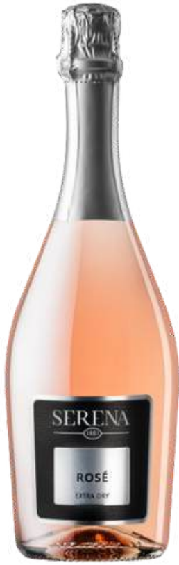
VINO ESPUMANTE SERENA WINES ROSATO 11 EXTRA DRY X 750 ML