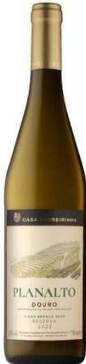
VINO BLANCO CASA FERREIRINHA PLANALTO RESERVA DOURO BLANCO 750 ML CÓDIGO: 8000002