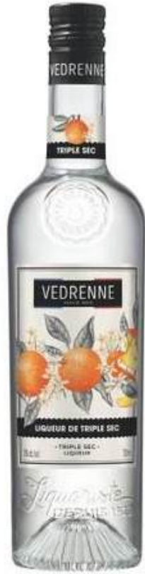
LICOR VEDRENNE TRIPLE SEC 35% 700 ML

Establecida en 1923 en Nuits- Saint- Georges, Francia, Vedrenne es conocida por sus licores y jarabes de alta calidad. La empresa ha ganado reconocimiento internacional por sus productos, especialmente la crema de cassis, y ha mantenido un compromiso con la excelencia y la innovación en la producción de licores y siropes.