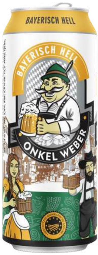
CERVEZA DE CEBADA BAYERISCH HELL ONKEL WEBER LATA X 500ML