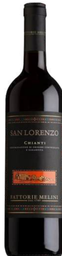
VINO TINTO SAN LORENZO CHIANTI DOCG X 750 ML