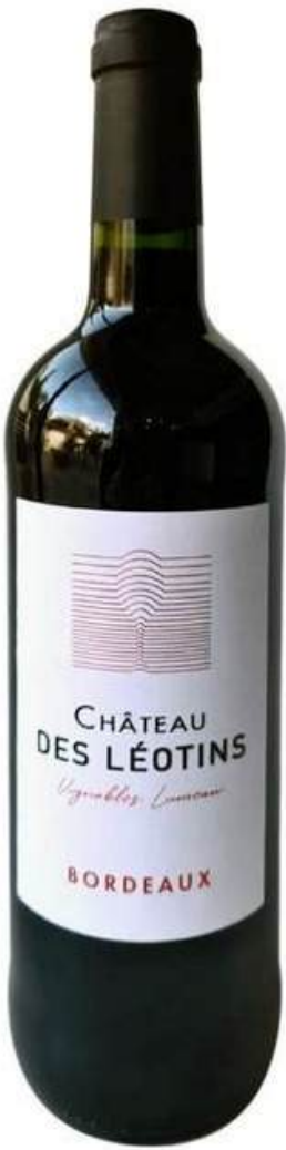
VINO TINTO CHATEAU DES LEOTINS VIGNOBLES LUMEAN 750 ML CÓDIGO: 4900002

Hreacno nocimreiceinbtidoo internacional en concursos, lo que respalda su prestigio dentro de la región de Burdeos.