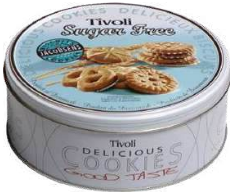
GALLETAS DULCES SIN AZÚCAR TIVOLI - SUGAR FREE COOKIES X 142 GR