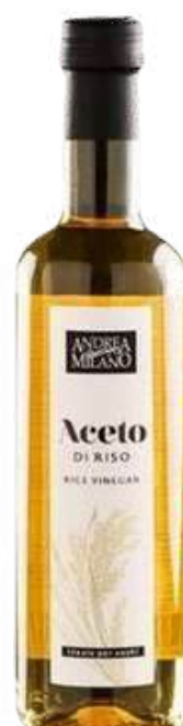
VINAGRE DE ARROZ ANDREA MILANO X 500 ML