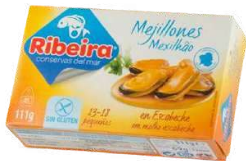
CONSERVA DE MEJILLONES EN ESCABECHE 13/18 SIN GLUTEN - RIBEIRA - 111G

Ribeira, marca perteneciente al Grupo Frinsa, ofrece una amplia gama de productos en conserva de pescado y mariscos de alta calidad. Sus productos gozan de buena reputación en el mercado gracias a su calidad y método de conservación natural, que permite mantener el sabor y los nutrientes. Se consideran una opción saludable dentro del segmento de conservas, con ingredientes bien seleccionados y sin aditivos. Además, la marca destaca por su compromiso con la sostenibilidad y la responsabilidad ambiental.