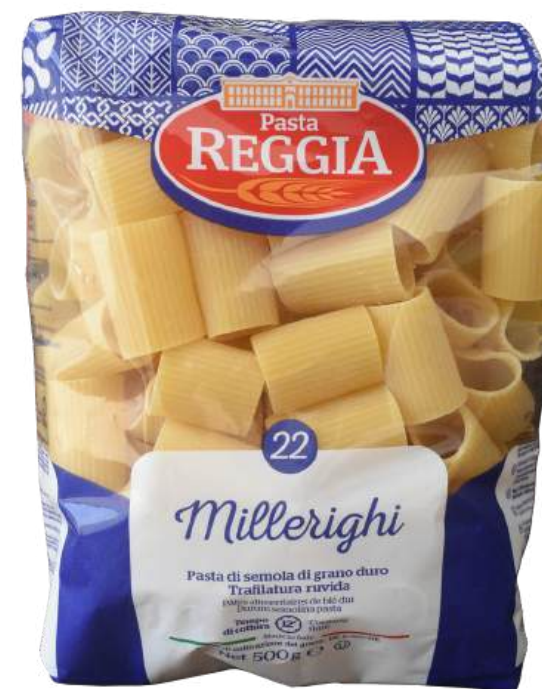
PASTA MILLERIGHI REGGIA X 500GR