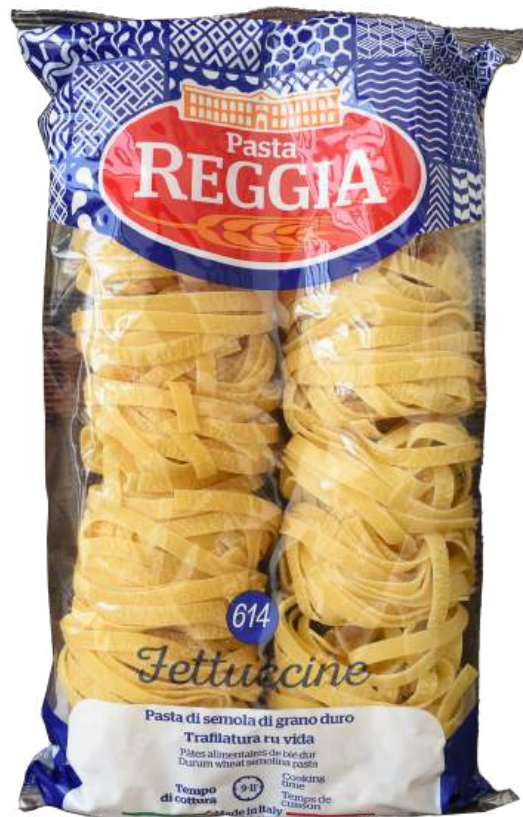
PASTA FETTUCCINI NIDI REGGIA X 500 GR