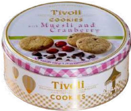
GALLETAS DULCES TIVOLI - MUESLI & CRANBERRY COOKIES X 150 GR

Sus galletas se caracterizan por su sabor delicado, textura crujiente y el uso de ingredientes de alta calidad. Además, la marca se distingue por sus elegantes envases metálicos, que no solo conservan la frescura de las galletas, sino que también se han convertido en un clásico para regalar. Jacobsens combina tradición y modernidad, ofreciendo desde sus recetas originales hasta nuevas variedades con sabores innovadores, manteniendo siempre el auténtico estilo danés que la ha hecho famosa a nivel mundial.