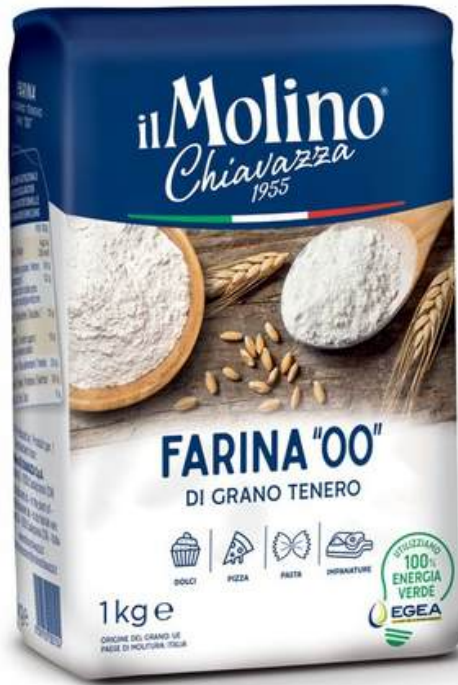
HARINA DE TRIGO BLANDO TIPO "00" IL MOLINO CHIAVAZZA 1 KG

Molino Chiavazza es una marca italiana reconocida por la calidad de sus harinas, caracterizadas por un riguroso proceso de selección del trigo y una molienda que preserva las propiedades del grano. Sus harinas se distinguen por una textura fina y uniforme, buen rendimiento en diversas preparaciones y estabilidad en la cocción, lo que las hace ideales tanto para uso doméstico como profesional. Además, la marca ofrece opciones ecológicas y de gran fuerza, garantizando productos con buena absorción de agua y fermentación óptima, que se traducen en una textura delicada en panes, pasteles y masas.