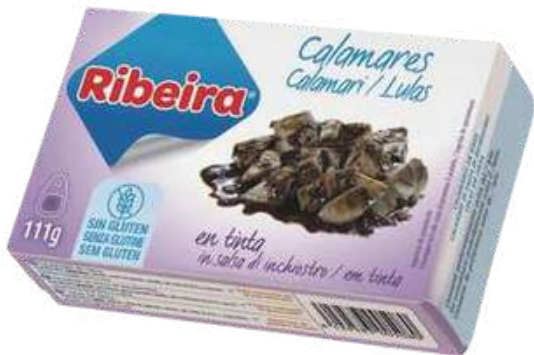
CONSERVA DE CALAMARES EN SU TINTA SIN GLUTEN - RIBEIRA - 111G