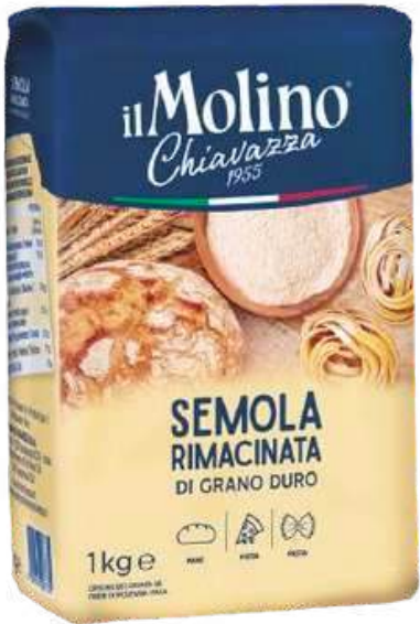
SEMOLINA DE TRIGO DURO IL MOLINO CHIAVAZZA X 1 KG