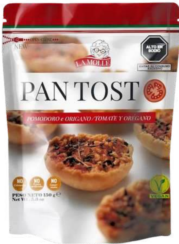
TOSTADAS LA MOLLE PANTOSTO POMODORO & ORIGANO X 150 GR

LA MOLLE no es solo una marca, es un homenaje. Un tributo a la calidez, la tradición y el amor con los que una abuela transforma lo simple en extraordinario. Es sinónimo de calidad, cariño y ese tlaoque especial que solo experiencia y el tiempo pueden brindar. Cada detalle refleja la esencia de quienes nos enseñaron que hecho con amor perdura para siempre.