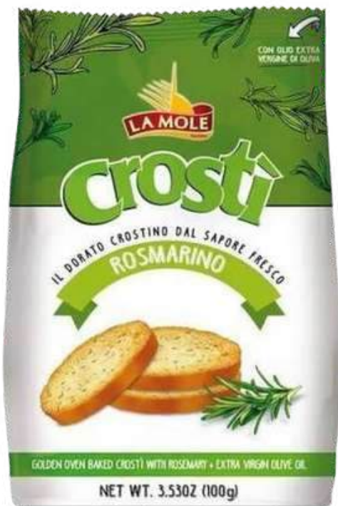
TOSTADITAS LA MOLE CROSTI ROSMARINO X 100 GR