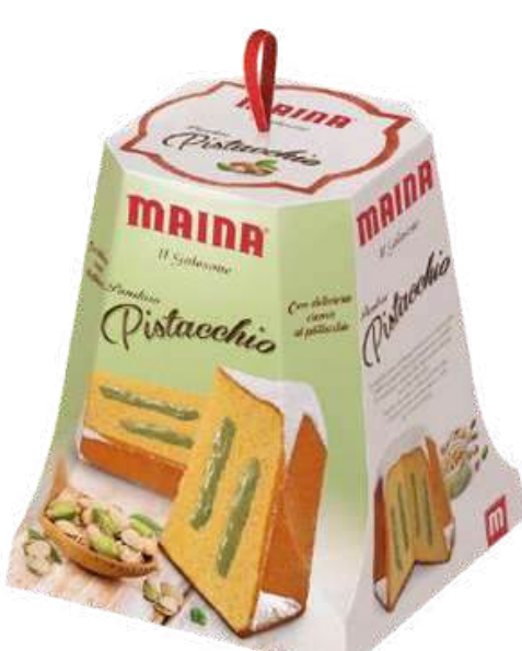
PANETON MAINA PANDORO GOLOSONE PISTACCHIO X 750 GR