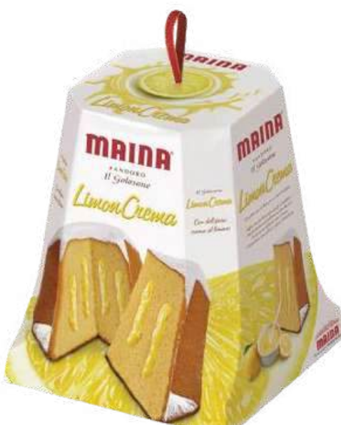
PANETON MAINA PANDORO GOLOSONE LIMONCREMA X 750 GR