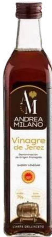
VINAGRE DE JEREZ ANDREA MILANO X 500 ML