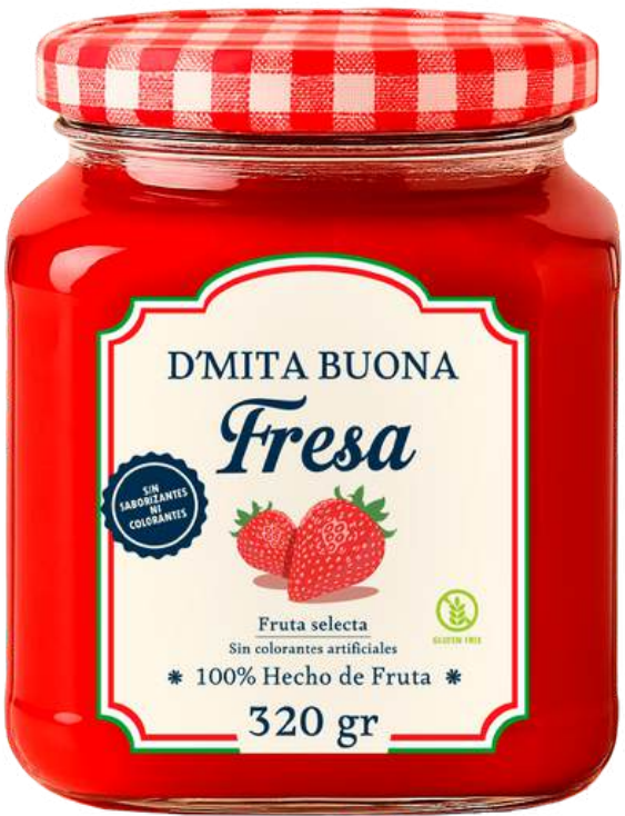
MERMELADA FRESA X 320 G