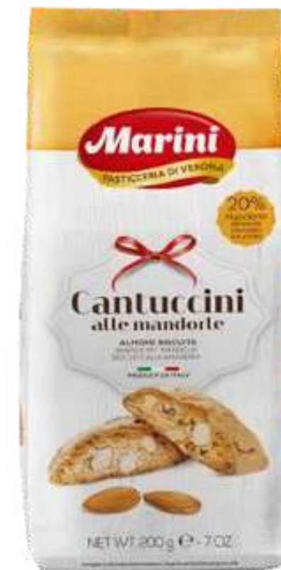
CANTUCCINI ALMONS MARINI 200G