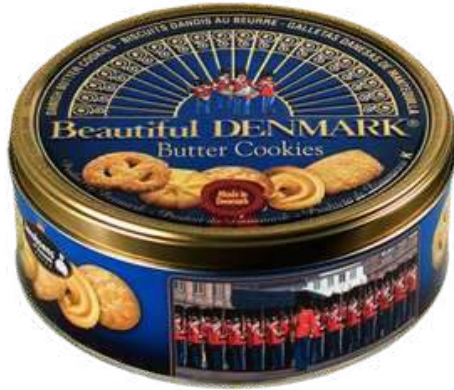
GALLETAS DULCES CON MANTEQUILLA BEAUTIFUL DENMARK X 150 GR