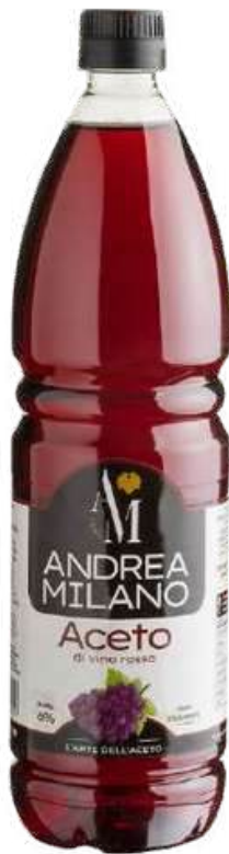
VINAGRE DE VINO TINTO ANDREA MILANO X 1 L

Andrea Milano, representada por Gourmet17 en Perú, es una marca gourmet especializada en la producción de aceites y vinagres de alta calidad. Sus aceites se extraen de las mejores aceitunas, cuidadosamente seleccionadas para garantizar sabor y pureza. Los vinagres se fermentan con frutas y especias, aportando un toque de acidez y aroma. Andrea Milano ofrece la posibilidad de disfrutar aceites y vinagres exquisitos y saludables, elaborados con ingredientes orgánicos y sostenibles. Andrea Milano, el arte del aceite y el vinagre.