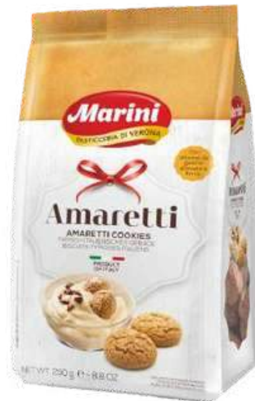
AMARETTI MARINI 250G