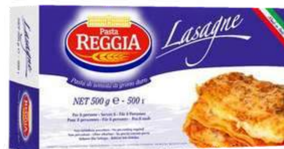
PASTA DE LASAGNE REGGIA X 500 GR