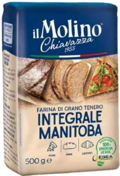
HARINA INTEGRAL DE TRIGO BLANDO MANITOBA IL MOLINO CHIAVAZZA X 500 GR