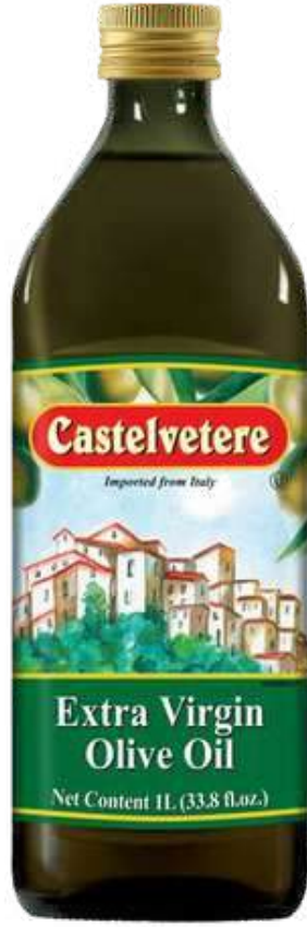
ACEITE DE OLIVA CASTELVETERE EXTRA VIRGEN X 1 L CÓDIGO: 24006