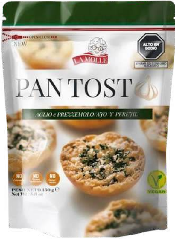
TOSTADAS LA MOLLE PANTOSTO AGLIO & PREZZEMOLO X 150 GR