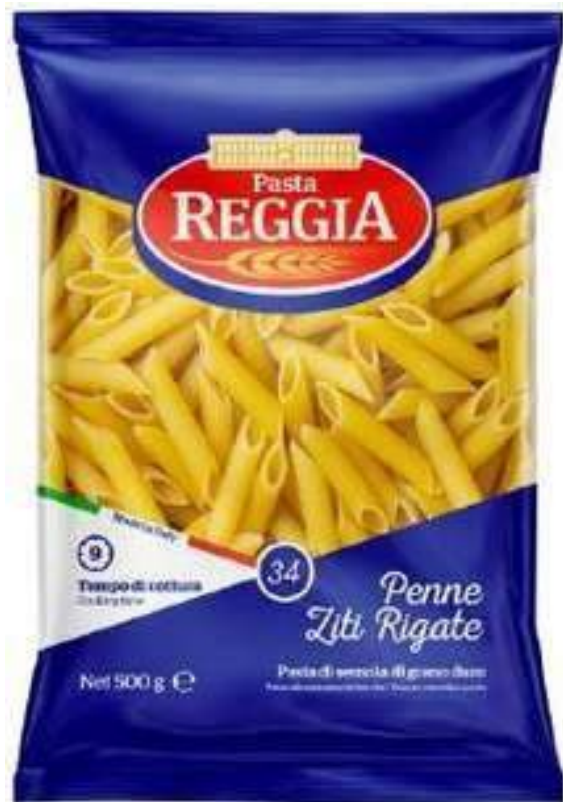
PASTA PENNE ZITI RIGATE REGGIA X 500 GR

Reggia, representada por Gourmet 117, es una marca de pastas italianas de alta calidad, reconocida por su tradición y recetas llenas de sabor. Está elaborada con sémola pura de trigo duro, sin conservantes, y pasa por un proceso de secado natural que le otorga una larga vida útil. Reggia ofrece una amplia variedad de productos, desde las clásicas lasañas, macarrones y espaguetis, hasta variedades especiales como nutri bio y nutri mio, pensadas para los gustos y preferencias de los consumidores más exigentes.