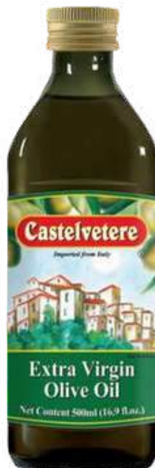
ACEITE DE OLIVA CASTELVETERE EXTRA VIRGEN X 500 ML