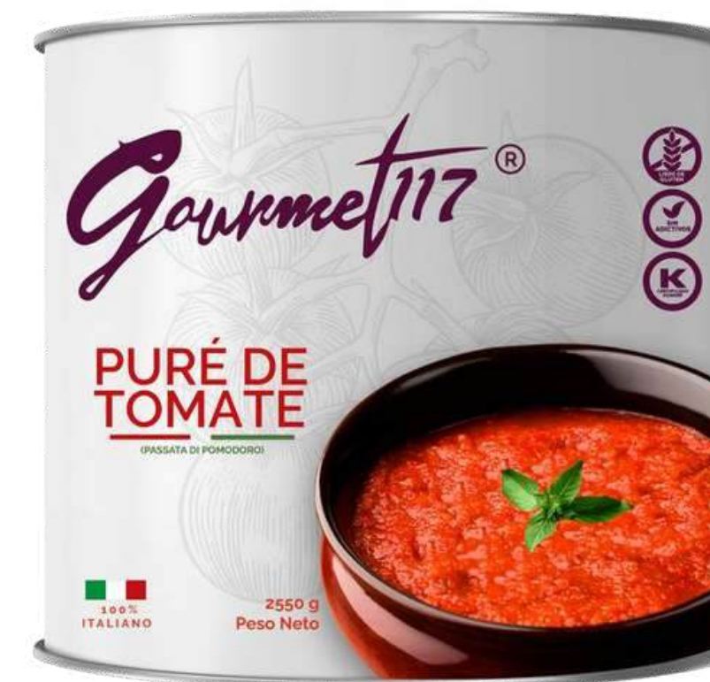
PURE DE TOMATE GOURMET 117 X 2.550 KG