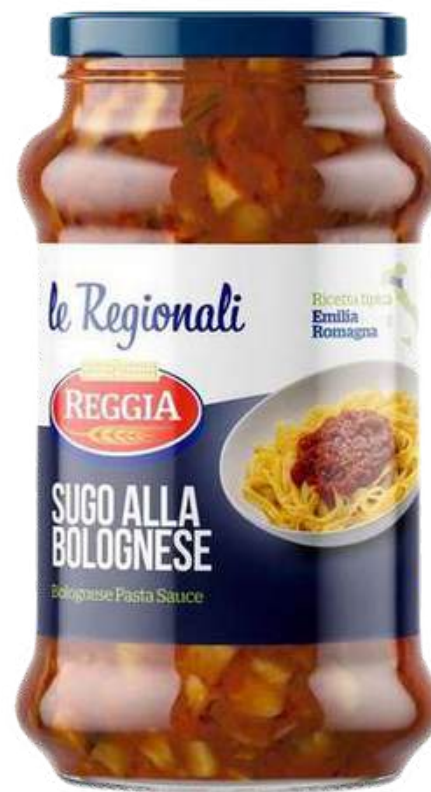
SALSA BOLOÑESA REGGIA X 350 GR

Reggia, representada por Gourmet 117, es una marca de pastas italianas de alta calidad, reconocida por su tradición y recetas llenas de sabor. Está elaborada con sémola pura de trigo duro, sin conservantes, y pasa por un proceso de secado natural que le otorga una larga vida útil. Reggia ofrece una amplia variedad de productos, desde las clásicas lasañas, macarrones y espaguetis, hasta variedades especiales como nutri bio y nutri mio, pensadas para los gustos y preferencias de los consumidores más exigentes.