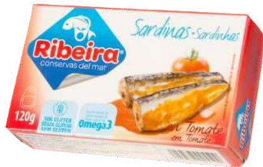
CONSERVA DE SARDINAS EN SALSA DE TOMATE SIN GLUTEN - RIBEIRA - 120GR