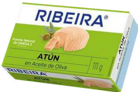
CONSERVA DE ATUN EN ACEITE DE OLIVA SIN GLUTEN - RIBEIRA - 111G