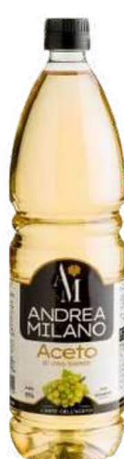
VINAGRE DE VINO BLANCO ANDREA MILANO X 1 L