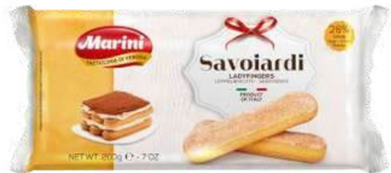
LADYFINGERS MARINI 200G

Marini es una marca italiana fundada en 1984, reconocida por su tradición y compromiso con la calidad en la elaboración de galletas. Con el equilibrio entre métodos artesanales e innovación, la marca ha alcanzado presencia internacional y cuenta con certificaciones como IFS, BRC y BIO. Representada en Perú por Gourmet117, Marini transmite la autenticidad y el prestigio de la repostería italiana a través de sus galletas, elaboradas con ingredientes simples y naturales que reflejan su filosofía de excelencia.