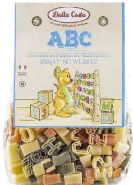
PASTA ABC TRICOLOR DALLA COSTA X 250 GR

Dalla Costa ofrece una pasta con formas divertidas para que los niños disfruten sus comidas. Está elaborada con sémola de trigo duro de alta calidad y formas coloreadas con ingredientes naturales como tomate y espinaca. Gracias a su proceso de secado lento, la pasta mantiene su forma y textura durante la cocción, asegurando una experiencia atractiva y deliciosa.