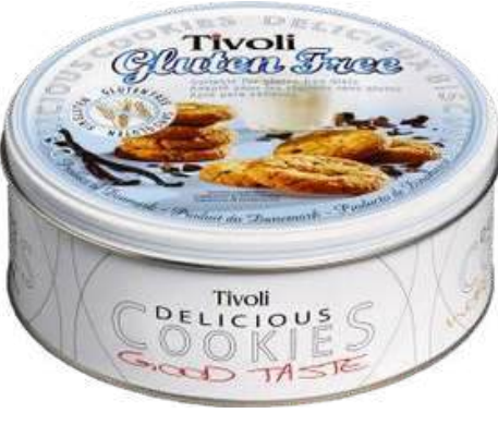
GALLETAS DULCES SIN GLUTEN TIVOLI – GLUTEN FREE CHOCOLATE CHIPS COOKIES X 142 GR