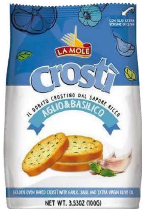
TOSTADITAS LA MOLE CROSTI AGLIO & BASILICO X 100 GR

La Mole, marca representada por Gourmet 117, es una marca de productos de panadería italiana de excelente calidad, que se basa en la tradición y el sabor de sus recetas. Sus productos son elaborados con ingredientes naturales y siguiendo un proceso artesanal de horneado. La Mole ofrece una gran variedad de productos, desde palitos, tostadas, galletas y crackers, hasta panes, focaccias y pizzas, que se adaptan a los gustos y preferencias de los consumidores más exigentes. La Mole es una marca gourmet, que combina la tradición y la innovación en sus productos, cuidando al máximo la calidad y la sostenibilidad