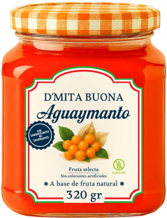
MERMELADA AGUAYMANTO X 320G