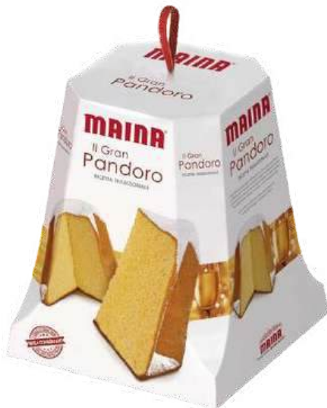
PANETON MAINA IL GRAN PANDORO X 1 KG