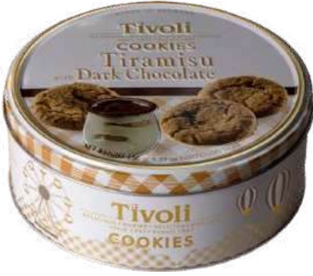
GALLETAS DULCES TIVOLI - TIRAMISU COOKIES (VAINILLA Y CAFÉ) X 150 GR