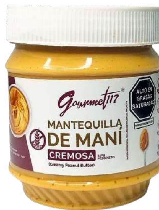
MANTEQUILLA DE MANÍ CREMOSA GOURMET 117 X 340 GR

La mantequilla de maní cremosa es un alimento hecho de cacahuetes (maníes) que se han molido hasta obtener una consistencia suave y cremosa. Es una opción popular para untar en pan o galletas, y también se utiliza como ingrediente en muchas recetas, como batidos, salsas y postres.