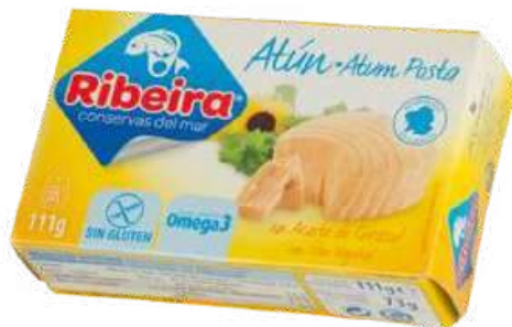
CONSERVA DE ATUN EN ACEITE DE GIRASOL SIN GLUTEN - RIBEIRA - 111GR CÓDIGO: 4100002