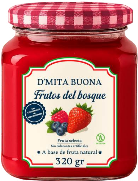
MERMELADA FRUTOS DEL BOSQUE X 320

El auténtico sabor italiano en cada cucharada. Nuestras cremas untables peruanas de receta italiana combinan ingredientes naturales, tradición y un delicado proceso artesanal, conservando ese sabor casero y genuino que se ha transmitido de generación en generación. D'Mita Buona es el placer de lo simple, lo auténtico y lo bien hecho con un toque de Italia para disfrutar en cualquier momento.