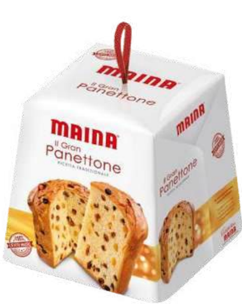
PANETON MAINA IL GRAN PANETTONE X 750 GR

Maina es una marca italiana representada por Gourmet 117, reconocida internacionalmente por su tradición, calidad y excelencia en repostería. Fundada en 1964 en Turín, ha sabido mantener la esencia artesanal en cada una de sus creaciones, combinando procesos de fermentación natural, selección de ingredientes de primera y una constante innovación. Con sede en Fossano, se ha consolidado como una de las empresas líderes en su sector, presente en más de 40 países y apreciada por consumidores que valoran la autenticidad y el cuidado en cada detalle. Maina refleja el verdadero espíritu de la repostería italiana, uniendo historia, pasión y compromiso con la excelencia.