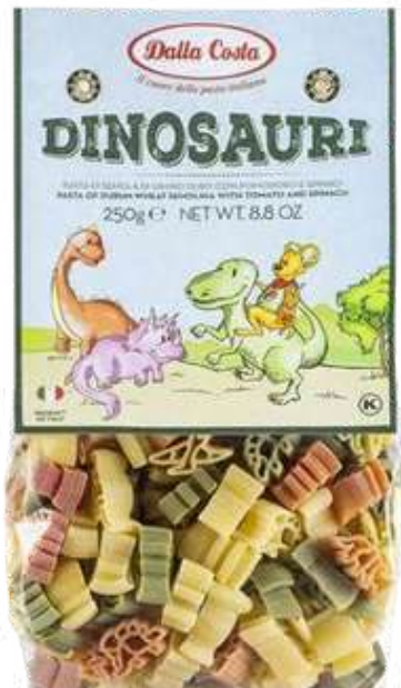
PASTA DINOSAURIO TRICOLOR DALLA COSTA X 250 GR