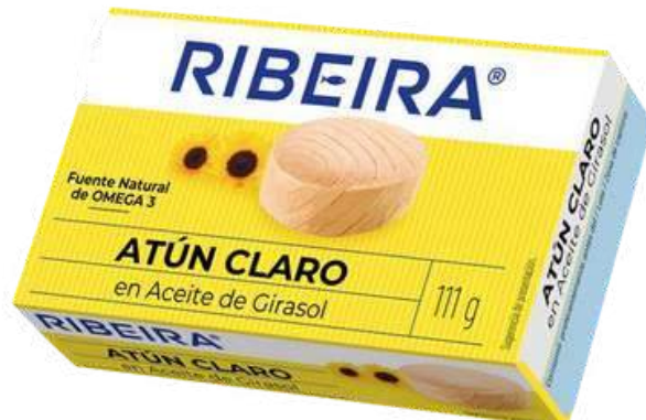
CONSERVA DE ATUN CLARO EN ACEITE DE GIRASOL - RIBEIRA - 111G CÓDIGO: 4100004