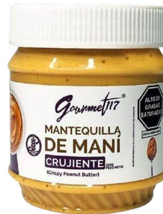
MANTEQUILLA DE MANÍ CRUJIENTE GOURMET 117 X 340 GR