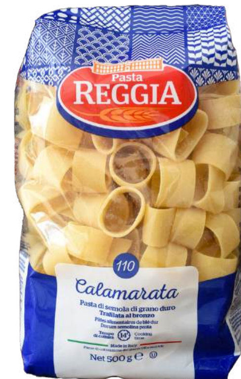
PASTA CALAMARATA REGGIA X500 GR