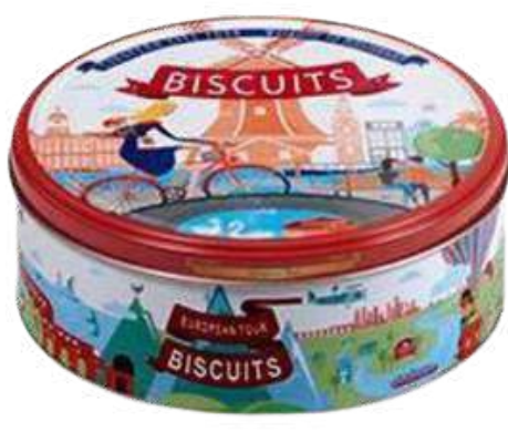
GALLETAS DULCES CON MANTEQUILLA Y CHOCOLATE EUROPEAN TOUR X 150 GR