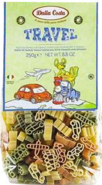
PASTA TRAVEL TRICOLOR DALLA COSTA X 250 GR