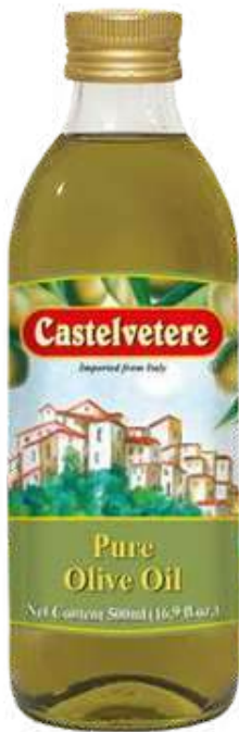
ACEITE DE OLIVA CASTELVETERE X 500 ML

Desde hace más de un siglo, la familia Basso produce aceite de oliva en Castelvetero, en las colinas de Irpinia, con pasión y respeto por la tradición. Su aceite de oliva virgen extra se distingue por su pureza, sabor equilibrado y cuidadoso proceso de elaboración. La marca ofrece una variedad de aceites en distintos formatos, adaptándose a las necesidades del consumidor moderno sin perder sus altos estándares. Es una opción confiable y saludable, con raíces profundas en la tradición italiana.