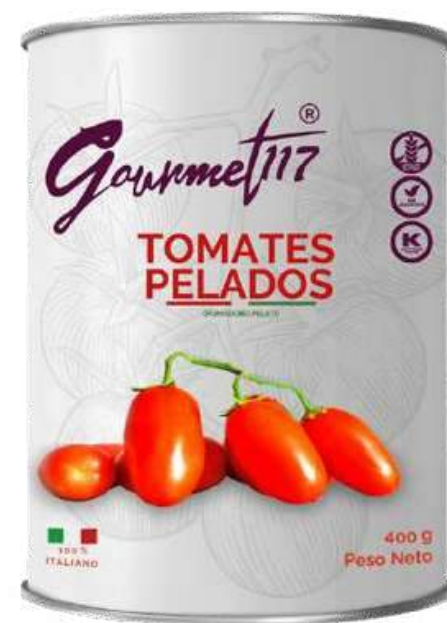
TOMATES PELADOS GOURMET 117 X 400 GR

Descubre el puré de tomate Gourmet117: hecho en Italia con tomates seleccionados que concentran frescura e intensidad. Su textura suave y uniforme lo convierte en la base perfecta para tus salsas caseras, guisos o recetas gourmet. Ideal para quienes buscan calidad auténtica y un sabor que marca la diferencia en cada plato.