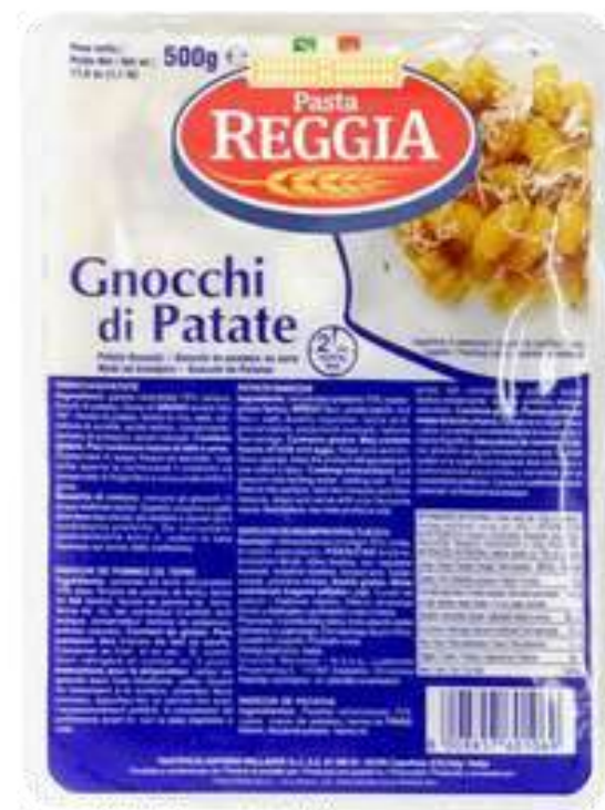
ÑOQUIS DE PAPA REGGIA X 500 GR

Reggia, representada por Gourmet 117, es una marca de pastas italianas de alta calidad, reconocida por su tradición y recetas llenas de sabor. Está elaborada con sémola pura de trigo duro, sin conservantes, y pasa por un proceso de secado natural que le otorga una larga vida útil. Reggia ofrece una amplia variedad de productos, desde las clásicas lasañas, macarrones y espaguetis, hasta variedades especiales como nutri bio y nutri mio, pensadas para los gustos y preferencias de los consumidores más exigentes.