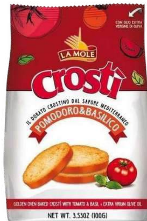
TOSTADITAS LA MOLE CROSTI POMODORO & BASILICO X 100 GR