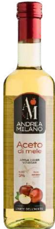
VINAGRE DE MANZANA ANDREA MILANO X 500 ML