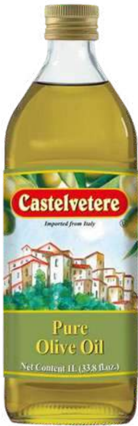
ACEITE DE OLIVA CASTELVETERE X 1 L