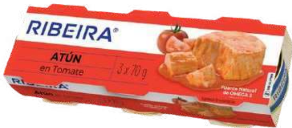
CONSERVA DE ATUN CON TOMATE - RIBEIRA - 3X52GR

Ribeira, marca perteneciente al Grupo Frinsa, ofrece una amplia gama de productos en conserva de pescado y mariscos de alta calidad. Sus productos gozan de buena reputación en el mercado gracias a su calidad y método de conservación natural, que permite mantener el sabor y los nutrientes. Se consideran una opción saludable dentro del segmento de conservas, con ingredientes bien seleccionados y sin aditivos. Además, la marca destaca por su compromiso con la sostenibilidad y la responsabilidad ambiental.