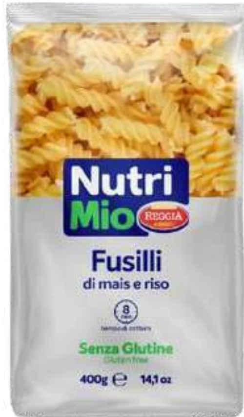
PASTA FUSILLI NUTRI MIO ( GLUTEN FREE ) REGGIA X400 GR