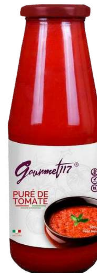
PURE DE TOMATE GOURMET 117 X 680 GR