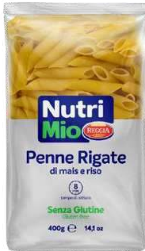
PASTA PENNE RIGATE NUTRI MIO ( GLUTEN FREE ) REGGIA X 400 GR