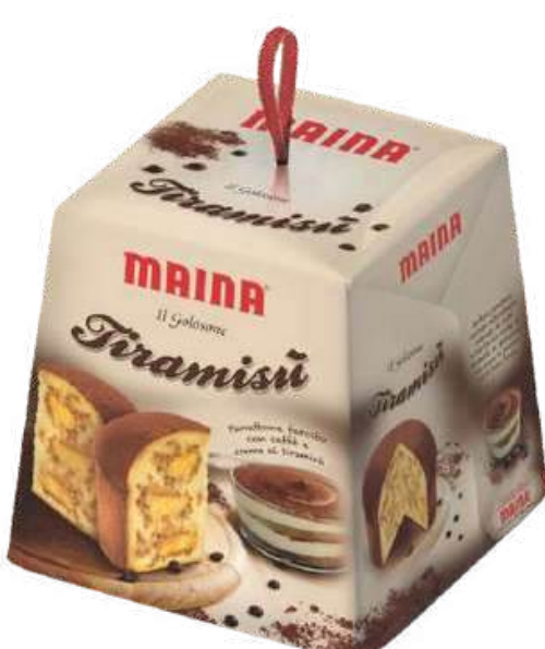
PANETON MAINA PANETTONE GOLOSONE TIRAMISU X 750 GR