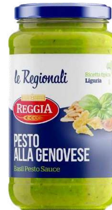
SALSA AL PESTO REGGIA X 190 GR